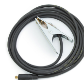
Earth return cable 5 m, 25 mm 2